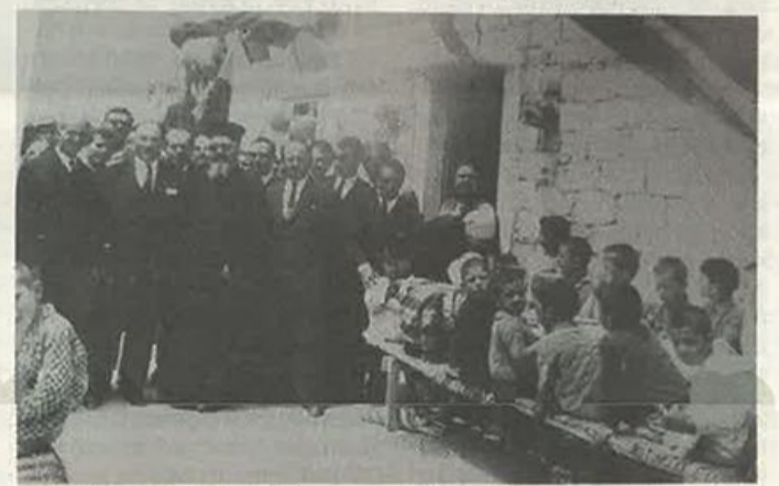
«Ζυσσίτια αγάπης» στο Πέραμα στις αρχές της δεκαετίας του '60.

του μέσα στα διαφημιστικά κουτιά στις στάσεις των λεωφορείων, που τις άνοιξε με ένα κατασβίδι. «Η πρώτη αντίδραση ήταν από μεθυσμένους. Όχι μεθυσμένους κριτικούς λογοτεχνίας. Μεθυσμένους κτηματομεσίτες, δικηγόρους, φουρνάρηδες, γενικώς μεθυσμένους που τα έβλεπαν νύχτα στη γειτονιά μου και αλλού», λέει γελώντας. Μια φορά τον συνέλαβαν οι αστυνομικοί: «Οι στίχοι μου εκείνη την περίοδο είχαν να κάνουν