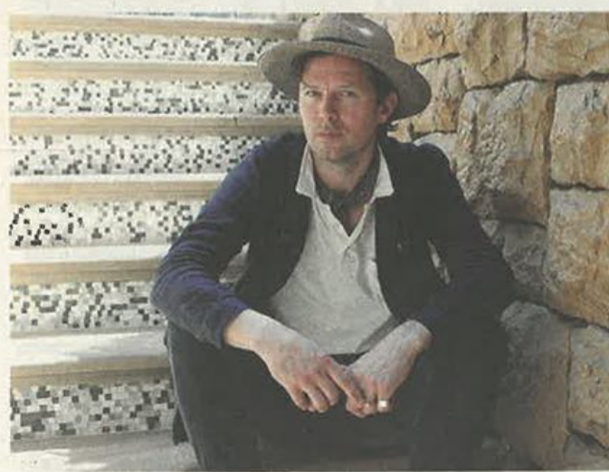
Ο Ρόμπερτ Μοντγκόμερι θα φιλοτεχνήσει το πρότζεκτ «Sharing Perama».

«Όλοι οι άνθρωποι μπορούν να το κάνουν όταν παύουν να ανησυχούν για το πώς θα πληρώσουν το ενοίκιο τους και άλλα οικονομικά και πρακτικά θέματα που μας βα-