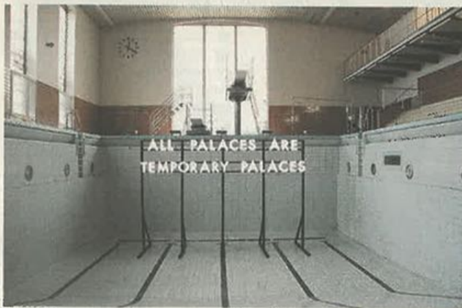
Εγκατάσταση με στίχους του Μοντγκόμερι εντός πισίνας κολυμβητηρίου.